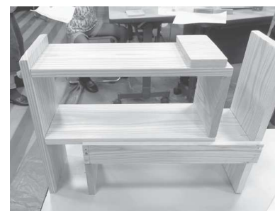
▲スライド式棚の出来あがり

お父さんやお母さんに手伝ってもらっていた子や、一人で最後まで丁寧に作り上げていた子などさまざまでした