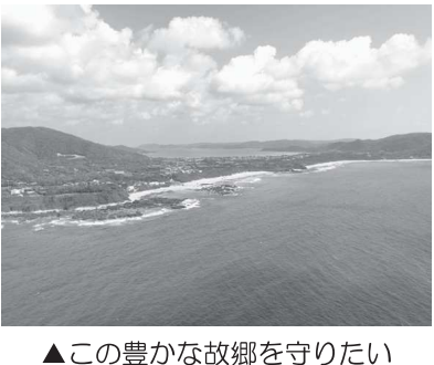
▲この豊かな故郷を守りたい

故郷の奄美大島に戻り、空港から市内に向かっていくと大型車両とすれ違うようになってきた。ニュースで自衛隊のミサイル基地が建設されていることは聞いていた。地元では自衛隊関係と知られるナンバープレートが車両が走り、側道に大型車両が出入りするゲートが見え、警備員が監視を行うゲートには熊本防衛支局と書かれている。今も港で海上保安庁の大型巡視船は見掛けるが、建設中の施設は完全なミサイル基地だ。市内には『憲法9条を守る』という大きな看板が商店街の入り口に取り付けられ、基地反対の様子をうかがわせている。