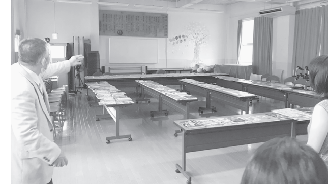
▲今年9月、京都市内の不登校特例校を見学。とても丁寧に行き届いた教育で、素晴らしいとは思いましたが、本来それは全ての学校で行われるべきことだと強く感じました。

不登校児童・生徒は全国で増加傾向となつていきましたが、特にコロナ禍で激増したと言われています。豊中市内でも年々増え続けており、昨年度では小学校360人、中学校540人、計約900名。さらに、一時間目からではなく二時間目とか三時間目から登校している。登校はするが自分の教室には入れず保健室などの別室で過ごしている。学校ではなく青少年文化交流館「いぶぎ」（服部西町。庄内と千里の少年文化館が「いぶぎ」に統合）に通っている。なので出席扱いとなつている。：等々の「不登校予備軍」まで含めると、千名を超える子どもたちが、普通に学校に通えていないのが現状です。