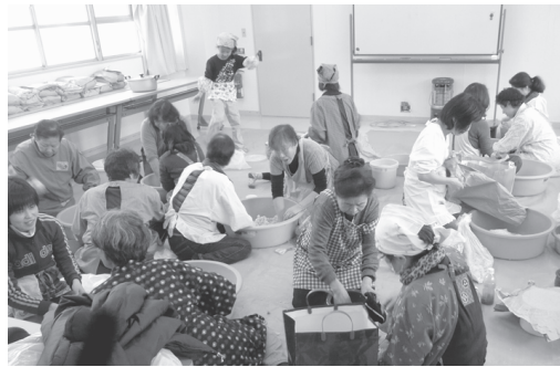
▲ 30年を超えて続く味噌づくり

「学習指導要領」に縛られず、子どもたち一人ひとりの個性や状態に合わせた柔軟な教育ができる特別な学校で、2005年の文科省令により設置が可能となりました。現在、全国で11都府県に24校あります（小学校5校、中学校18校、高校3校。うち2校は小中併設。公私の別は公立14、私立10）。来年4月に大阪府が府下初となる特例校の開設を予定しています。