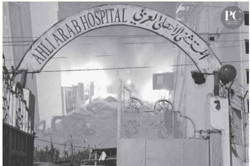
▶破壊されたアハリー・アラブ病院。（パレスチナ・クロニクル紙2023年10月17日）

イスラエルはハマスをガザから一掃すると宣言したが、ハマスはパレスチナ人を代表しており、これはつまり、パレスチナ人を一掃しシナイ半島に追いやるというナクバ（大災厄）の再現である。今回の武力衝突により既にイスラエルは85000人のパレスチナ人を虐殺している。