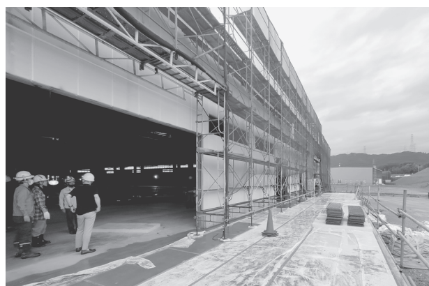
建設中の新物流センター

「気候危機」「食糧危機」「エネルギー危機」「戦争危機」など。時代はますます混沌としてきました。世界各地で分断と差別が蔓延し、異常な物価高によって多くの人の暮らしが圧迫され、私たちの活動にも大きな影響を与えています。ほんの一握りの人が富の大部分を独占し、世界中の大半の人々が格差と貧困の中で苦しんでいる時代。私たちの暮らしもまた厳しい状況が続いています。 そんな情勢下ですが、新センター移転にむけて、多くの課題に何とか対処することができました。これもひとえに、株主やパート・職員のみならず、そして何よりよつ葉の各社・産直センターのみならずのおかげだと考えています。改めて感謝申し上げます。 さて、今期の総会は、新センター完成の年でもあり、次の課題にむけて進めていくことになりました。6月30日（金）に開催された安全食品流通センターの「第37期通常株主総会」は、参加人数は39